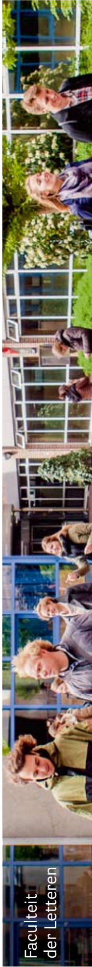
Faculteit der Letteren