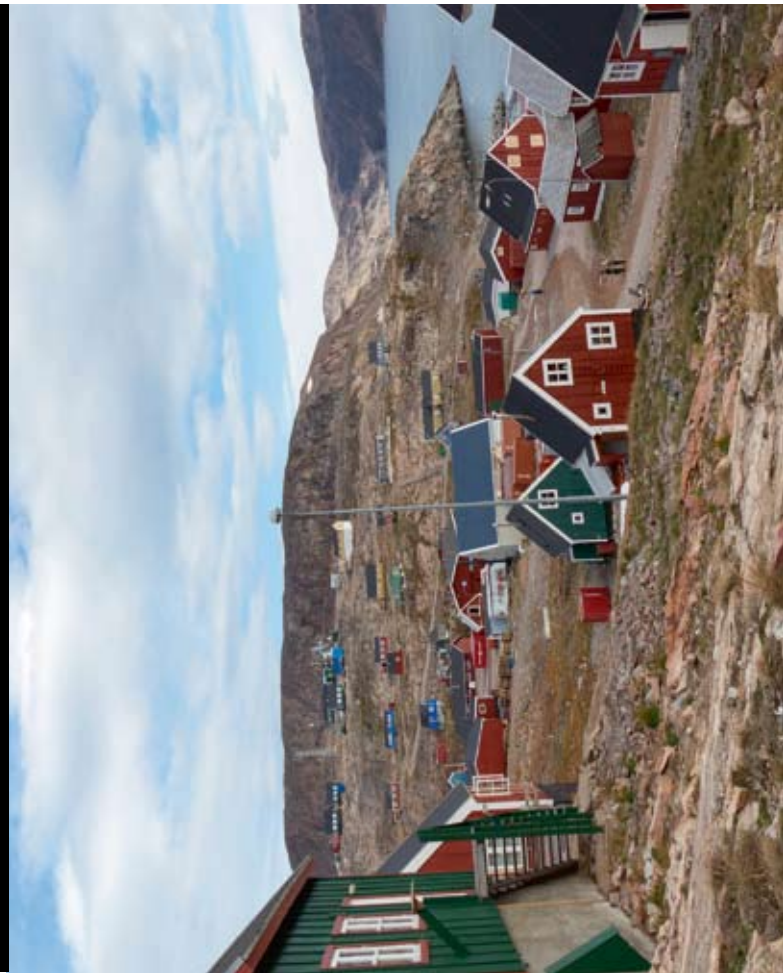
Onderzoeksstation Arctisch Centrum op Spitsbergen.